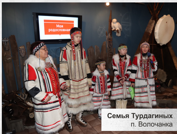
Семья Турдагиных п. Волочанка

Организаторы фестиваля 2025 года особо отметили важность участия в нём юных северян: такие массовые события придают чувство сплоченности, общности, – принадлежности к сообществу единомышленников. Особое внимание уделено детям, для которых организовали игры, экскурсии по северным жилищам, где они могли познакомиться с культурой, кухней и традициями долган, ненцев, нганасан, эвенков и энцев.