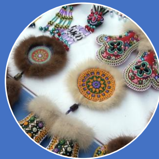
Союзы и ассоциации